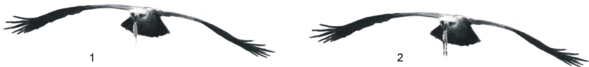
Rys. Orlik krzykliwy przenoszący zdobycz: 1. gryzoń, 2. żaba.

Jeśli orlik przelatuje z upolowaną zdobyczą niedaleko od obserwatora możliwe jest oznaczenie upolowanej ofiary nawet przy użyciu lornetki. Orliki przenoszą zdobycz zazwyczaj w dziobie. Rzadko przekładają ją do szponów, a jeśli to się zdarzy oznaczenie zdobyczy jest znacznie trudniejsze. Orlik który zamierza pożreć zdobycz siada zazwyczaj w pobliżu miejsca łowów i może do takiego punktu przelecieć używając lotu czynnego. Jeśli natomiast zamierza nakarmić pisklę lub samicę długo krąży, stopniowo nabierając wysokości, aby następnie długim ślizgiem zapaść w okolice gniazda. Takie zachowanie umożliwia dokładniejsze oznaczenie upolowanej zdobyczy.